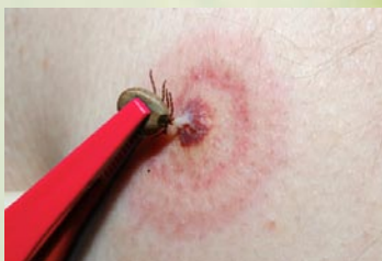
Rys. 2. Usuwanie kleszcza

Główne zagrożenie, jakie stanowią dla ludzi kleszcze to przenoszone przez nie choroby. Drobnoustroje chorobotwórcze przedostają się do kleszczy wraz z krwią zakażonych żywicieli. Do zakażenia dochodzi w czasie ukłucia – rys. 2, gdy następuje bezpośrednie wprowadzenie zarazków do krwi. W Polsce najczęściej przenoszone przez nich choroby to: borelioza i kleszczowe zapalenie mózgu (kzm).